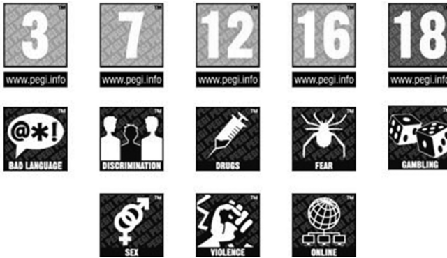
Imagen 2. Iconos del sistema PEGI para la catalogación por temáticas

Dichos iconos deberán aparecer en la caratula del videojuego, y los padres deberán entender estos símbolos en los siguientes términos: