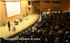
Panorámica del salón de actos