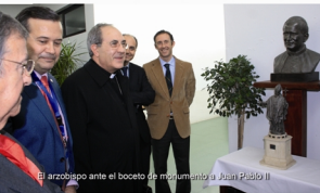
El arzobispo ante el boceto de monumento a Juan Pablo II