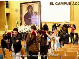
Alumnos portan la Cruz y el Icono de la JMJ