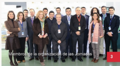
Miembros de la organización de las Jornadas