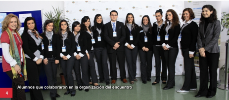
Alumnos que colaboraron en la organización del encuentro

José Manuel Otero subrayó la naturaleza del cristianismo como cultura, amen de una religión. "La cultura cristiana -matizó- es un subproducto de lo religioso, cultura susceptible de ser compartida por creyentes y no creyentes". Esa coincidencia de creyentes y no creyentes es, a su juicio, tradicional: "se proclamaba en tiempos antiguos, también actualmente, por pensadores católicos, pensadores no católicos pero próximos a lo cristiano, por pensadores ateos respetuosos con la religión. Incluso por pensadores ateos que pretenden borrar la idea religiosa del mundo, pero que confiesan que nuestra sociedad sigue siendo culturalmente cristiana y