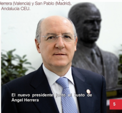
El nuevo presidente junto al busto de Ángel Herrera

La ACdP, fundada hace un siglo por el padre jesuita Ángel Ayala y cuyo primer presidente fue el siervo de Dios Ángel Herrera Oria, es una agrupación de seglares católicos reconocida por la Conferencia Episcopal Española e inscrita en el Registro de Entidades Religiosas del Ministerio de Justicia. ■