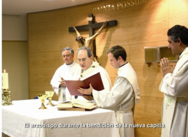
El arzobispo durante la bendición de la nueva capilla

Al término del acto, el arzobispo ha departido con los miembros de la comunidad universitaria del campus, y ha sido informado de la actualidad de este centro, así como de los proyectos educativos que la Fundación ha acometido. ■