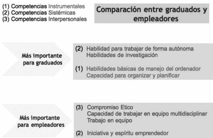
Figura 2. Valoración de competencias según universitarios y empleadores (según Barraycoa y Lasaga, 2009)

Por otro lado, en estudios realizados por Barraycoa y Lasaga (2009), la valoración que hacen universitarios y empleadores sobre qué competencias son más importantes, devuelven diferencias como se muestra en la figura 2. También se recoge poca coincidencia entre universitarios y empleadores respecto a la concepción del trabajo en grupo. Estos últimos, los empleadores consideran deficitaria la capacidad de trabajar en equipo en los titulados. Al mismo tiempo reconocen que el trabajo en grupo supone la interdependencia de actitudes entre los miembros del grupo, y no sólo una suma de tareas.